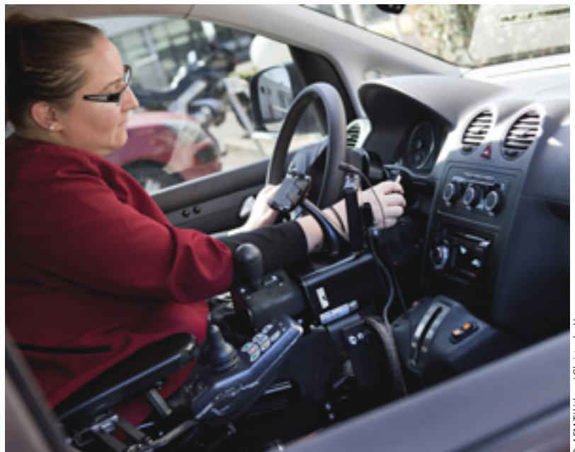
Le permis doit être régularisé sur la voiture équipée des nouveaux aménagements.