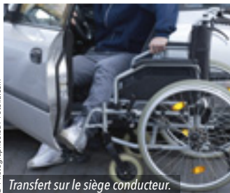
Transfert sur le siège conducteur.