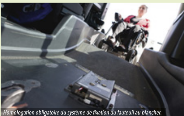
Homologation obligatoire du système de fixation du fauteuil au plancher.