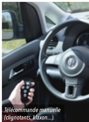
Télécommande manuelle (clignotants, klaxon...).